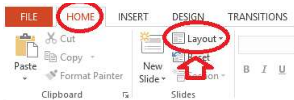
Gambar II - 62. Tata letak ( layout )

Dalam perangkat lunak presentasi PowerPoint terdapat fitur tata letak ( lay out ) tayangan ( slide ). Cara menggunakannya, klik tombol lay out yang terdapat pada tab Home .