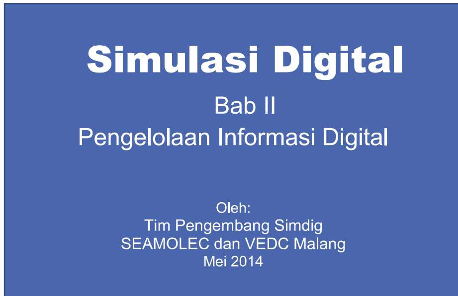
Gambar II - 64. Contoh tampilan halaman judul

Berikut ini contoh halaman judul sebuah paparan.